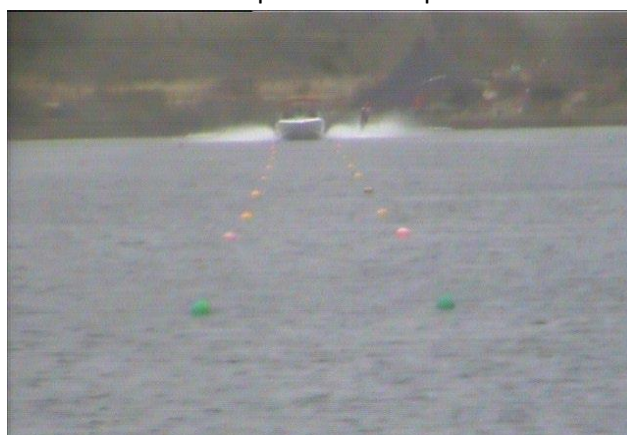
Недостаточное увеличение, слишком зернистое изображение