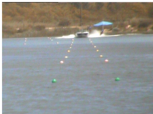
Недостаточное увеличение, слишком зернистое изображение