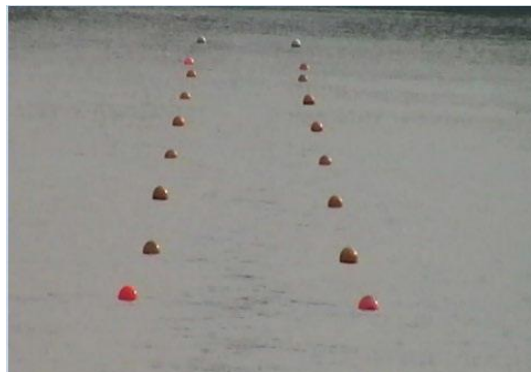
Не видны края монитора, камера установлена слишком высоко