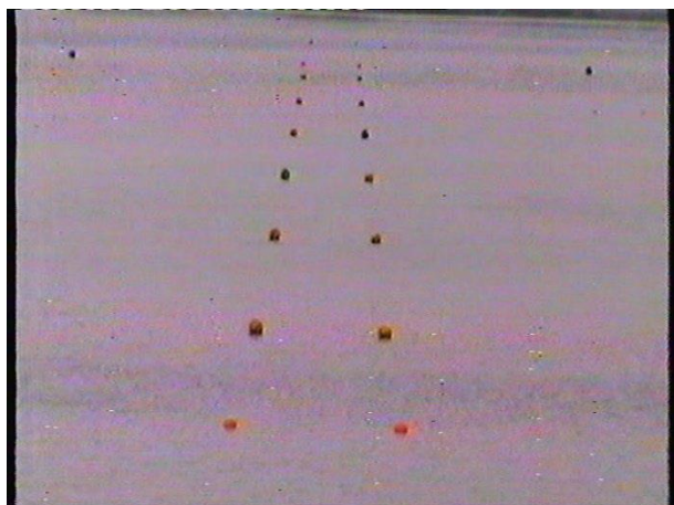
Камера установлена слишком высоко, недостаточное увеличение

Примеры неправильного размещения камеры, ведущей съемку курса катера: