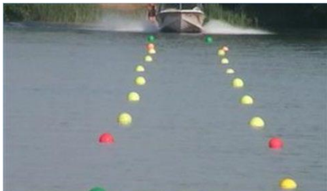
Не видны края монитора

Примеры неправильно сделанной фотографии изображения с курсовой видеокамеры: